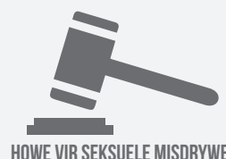
HOWE VIR SEKSUELE MISDRYWE

Die idee van howe vir seksuele misdrywe is in Suid-Afrika ontwikkel. In 2013 is 'n nuwe model vir howe vir seksuele misdrywe ontwikkel, wat alles uiteensit wat nodig is vir 'n hof om 'n hof vir seksuele misdrywe te wees. Hierdie model vereis van hierdie howe om spesiaal opgeleide aanklaers*, hofondersteuners en landdroste** te hê. 'n Hof vir seksuele misdrywe het 'n aparte hofsaal. Dit het ook 'n getuigkamer met geslote kringtelevisietoerusting, waar kinders kan getuig sonder om die verkragter of seksuele oortreder van aangesig tot aangesig hoef te sien, terwyl hulle praat oor wat gebeur het.